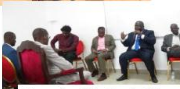
Des panels enrichissants sur des thèmes d'actualité animés par des experts et professionnels du métier.