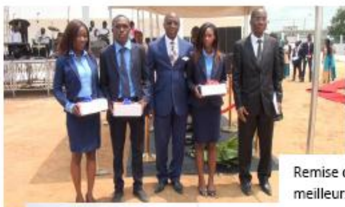
Remise de lots aux meilleurs étudiants

Vous désirez revivre les moments forts du Trentenaire ? NE RATEZ PAS LE PROCHAIN NUMERO « SPECIAL TRENTENAIRE » RICHE EN PHOTO-IMAGES