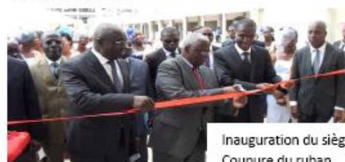
Inauguration du siège- Coupure du ruban