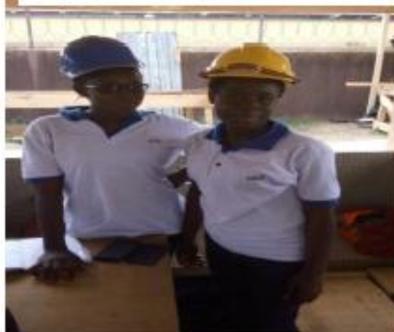
ESCOBAT sortie en zone industrielle de Yopougon