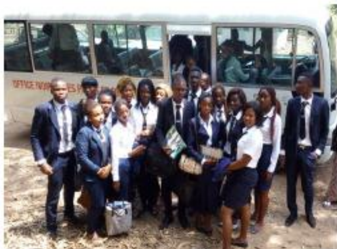
ESCOENVIRONNEMENT à l'inauguration de la nouvelle réserve naturelle de Dalia Fleur située sur la route Faya-Abatta Bingerville