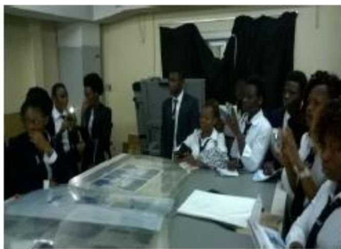
Le 23 Mars les étudiants d'ESCOCOM étaient en visite à Fraternité Matin pour apprendre comment fonctionne un organe de presse.