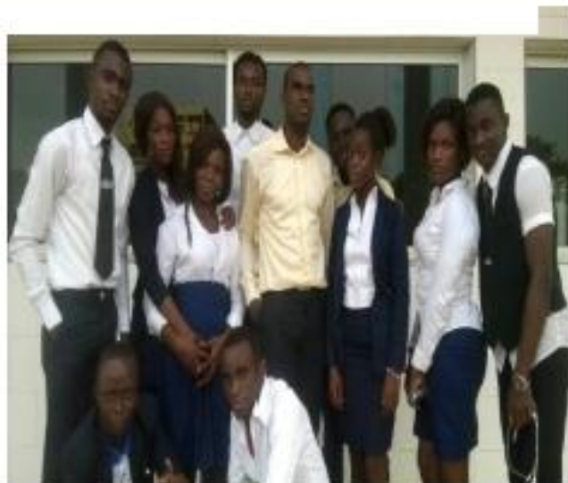
ESCO'ART et les membres de son bureau